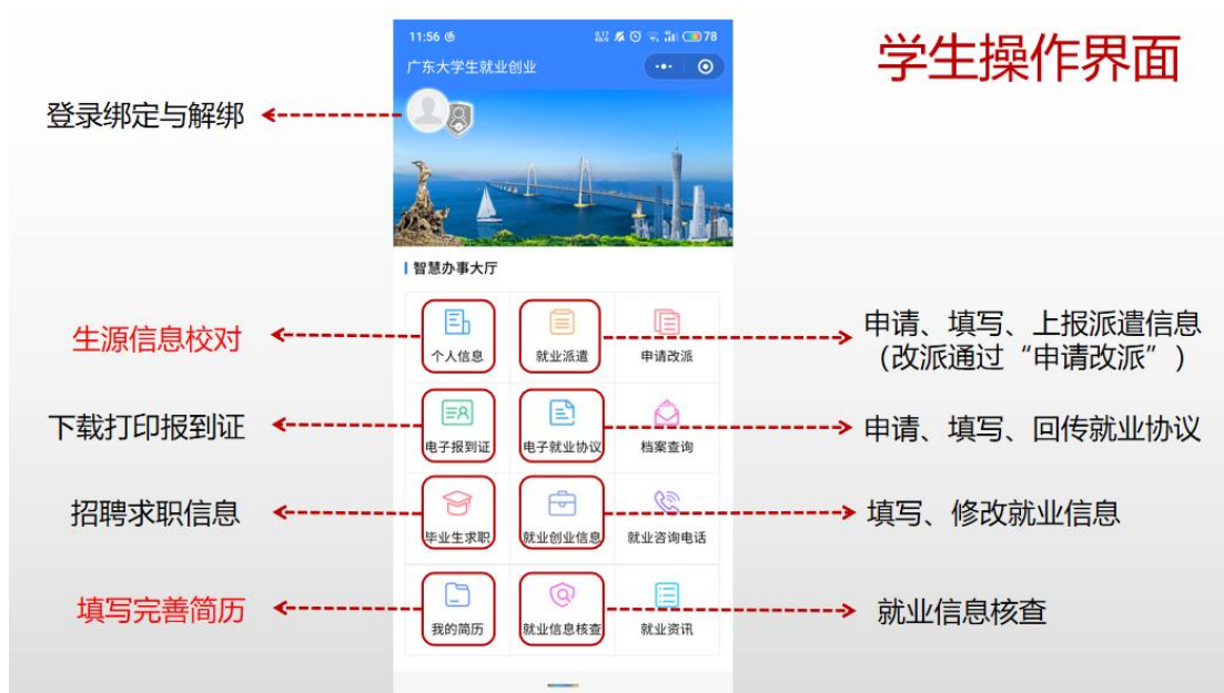
图 1 学生操作界面

步骤 4: 通过“我的简历”入口，填写完善简历信息，以便平台精准匹配并推送求职信息。详见附件 2《毕业生撰写提交电子简历操作流程》。