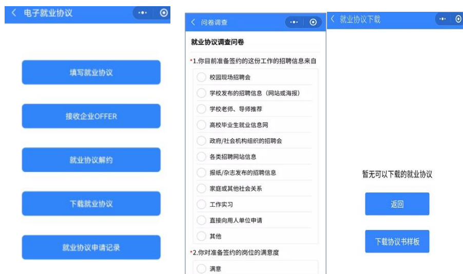
第一步与第二步系统图示

第一步：绑定登录小程序。 2024 届生源审核通过的学生登录“广东大学生就业创业”小程序，在“电子就业协议书”模块选择“填写就业协议”，完成“调查问卷”、“勾选确认知情协议”后，可以填写就业协议内容。